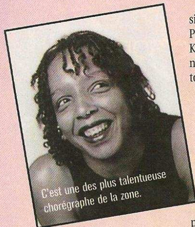
C'est une des plus talentueuse chorégraphe de la zone.

Maché dwèt kon-pikèt ! Maché kochi ! Maché anba ! Non, ce ne sont pas des injonctions... Ces expressions désignent trois des douze « pas fondamentaux » du Léwoz, l'une des sept danses du Gwo-ka. Il y en a